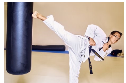
Beschreibende Grafik- oder Bildunterschrift.

scheidet sie sich von anderen. Die Taekwondo-Technik legt sich sehr auf die Schnelligkeit und Dynamik aus. Im Taekwondo dominieren Fußtechniken deutlicher als in vergleichbaren Kampfsportarten. Die Sportart ist sehr interessant und es lohnt sich sie einmal auszuprobieren. (SB)